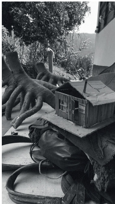
Figura 03 ▼ Metodologías alternativas de enseñanza - investigación de la arquitectura.

Además de lo anterior, es necesario que los docentes como formadores de profesionales de calidad respondan a los requerimientos actuales tanto para actividades de enseñanza como de investigación conociendo los tipos que existen, el enfoque que se les puede aplicar y la manera en que estas contribuyen a la construcción de la academia y de comunidades de investigadores que incrementen el valor de la investigación en educación y pedagogía. De esa manera, cada investigación o practica que realicen los profesores tendrá unas bases sólidas y contribuirá verdaderamente a la construcción de conocimiento para que este posteriormente sea aplicado por los profesionales.