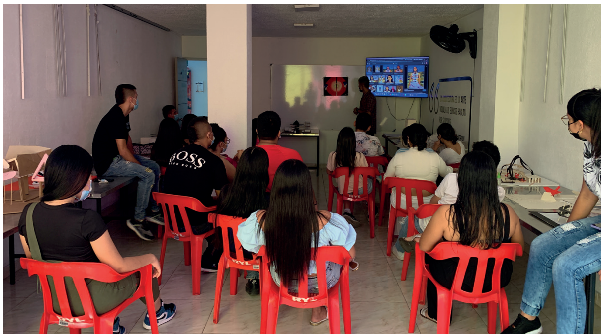
Figura 01 ▼ Taller tradicional de arquitectura en UNIMETA

La actualidad no solamente trae avances tecnológicos, también presenta cambios sociales importantes. En el contexto colombiano quizás el mejor ejemplo de este tipo de transformaciones es el posconflicto, en el que recién el país está entrando y, que marca pautas clave para la educación de los profesionales actuales. Este cambio implica por un lado la reformulación de la manera de enseñar y por el otro los contenidos que se brindan en las I.E.S de acuerdo al contexto social actual ya que, según Londoño (2014) la educación siempre ha estado directamente relacionada con las condiciones históricas del momento. Esto implica mayor conciencia de los problemas presentes en el contexto nacional.