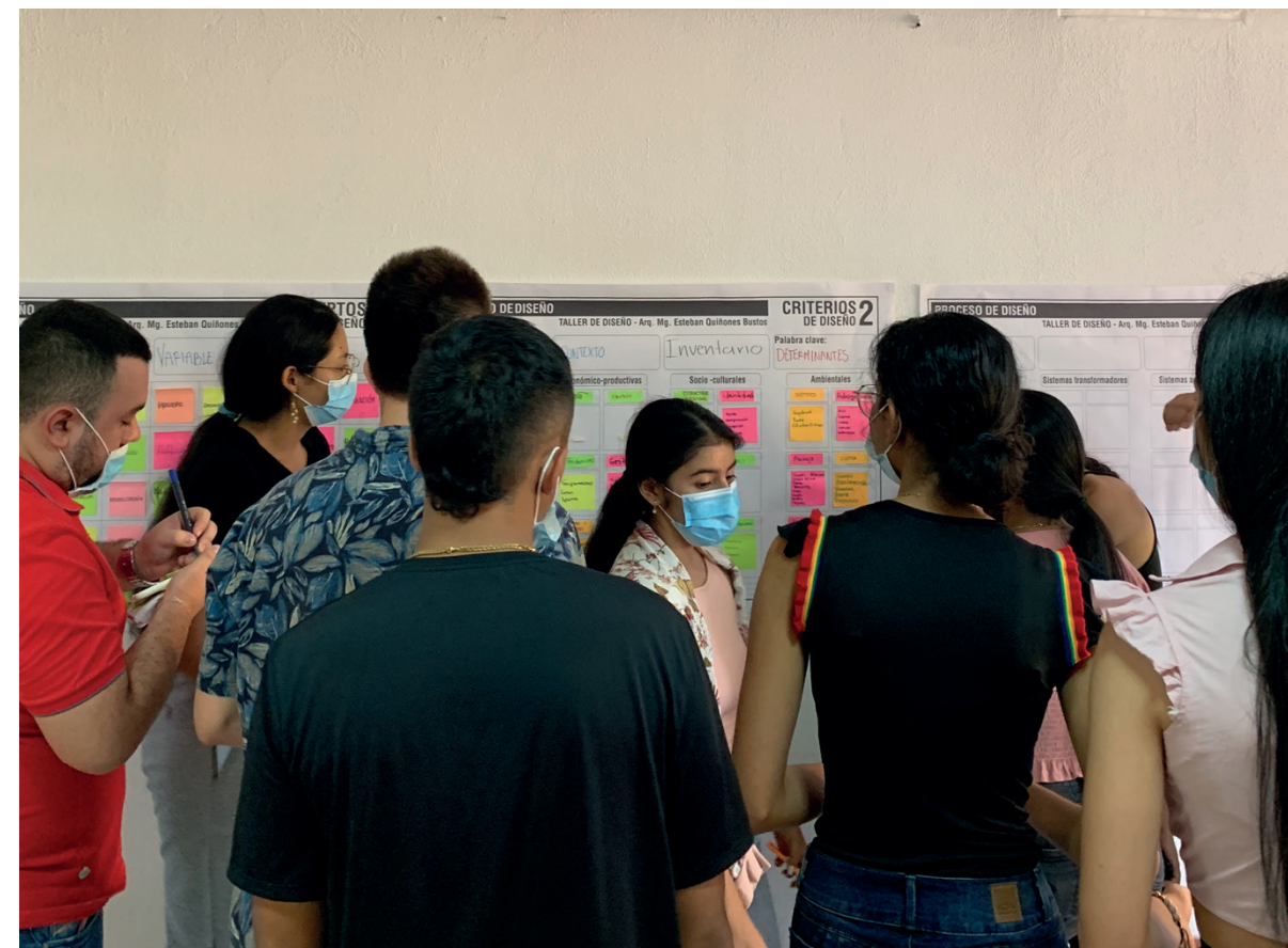
Figura 02 ▼ Estrategias de actualización en taller de arquitectura en UNIMETA

problemáticas legales. Según los autores, estos saberes son “saber ser, saber hacer, saber conocer y saber convivir” y estos permiten resolver los problemas con “sentido de reto, motivación, flexibilidad, creatividad, comprensión y emprendimiento”. Es de esta manera como los profesionales no solamente tienen calidad en sus procesos de formación si no también en la aplicación del conocimiento en pro de la solución de problemas y el mejoramiento de comunidades o contextos desde su profesión.