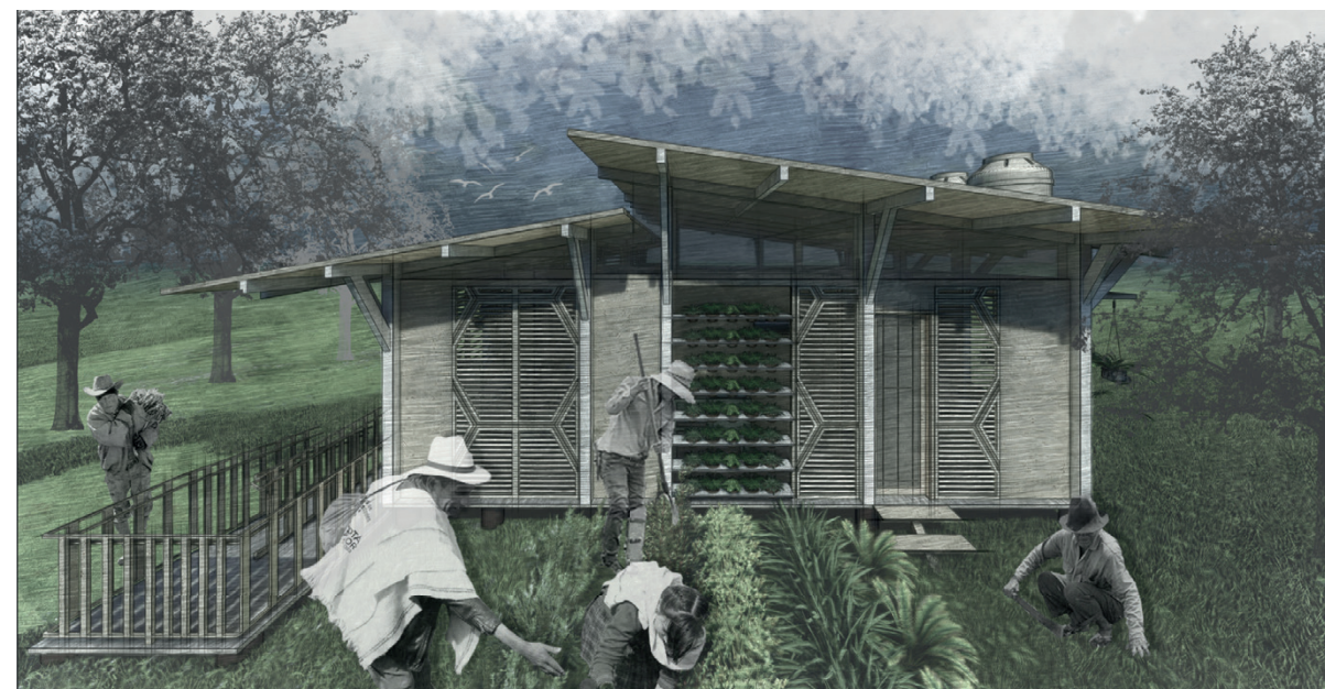
Figura 01 ▼ Imaginario general de la vivienda.

La propuesta va dirigida a aquellas comunidades vulnerables, en donde estas se ven afectadas por los fenómenos emergentes que implican el despojo de tierras, la distribución incorrecta de la propiedad, el desplazamiento, el conflicto armado, el cultivo ilícito y la deforestación. Las poblaciones que se identifican con estos fenómenos emergentes, son personas del común; ganaderos, agricultores, pescadores y campesinos a quienes el abandono estatal y la falta de recursos y oportunidades, les hace casi imposible satisfacer las necesidades básicas.