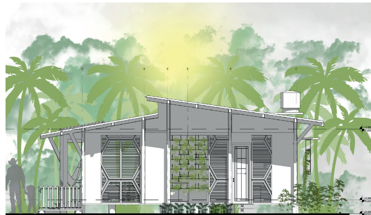
Figura 04 ▼ Fachada lateral derecha de la vivienda.

A modo de cierre el proyecto puede ser llevado a cabo como vivienda individual o agrupada en contextos con problemáticas similares a las de San José del Guaviare. Por ende, se habla de que es una vivienda asequible, flexible y sostenible, promoviendo así la superación de las dificultades e impulsando el desarrollo económico, social, ambiental y cultural, dando paso al término de Resiliencia Territorial como símbolo de identidad.