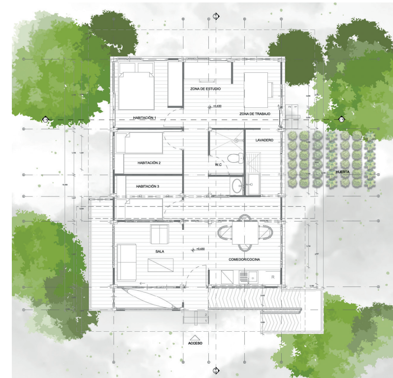
Figura 03 ◀ Plano general.

los rayos solares para posteriormente convertirlos en corriente eléctrica. En cuanto a las aguas lluvias, estas son captadas en la cubierta trasera de la vivienda, permitiendo que puedan ser utilizadas después para suplir las necesidades básicas de la vivienda, tales como el riego de los cultivos, el aseo personal o lavabo.