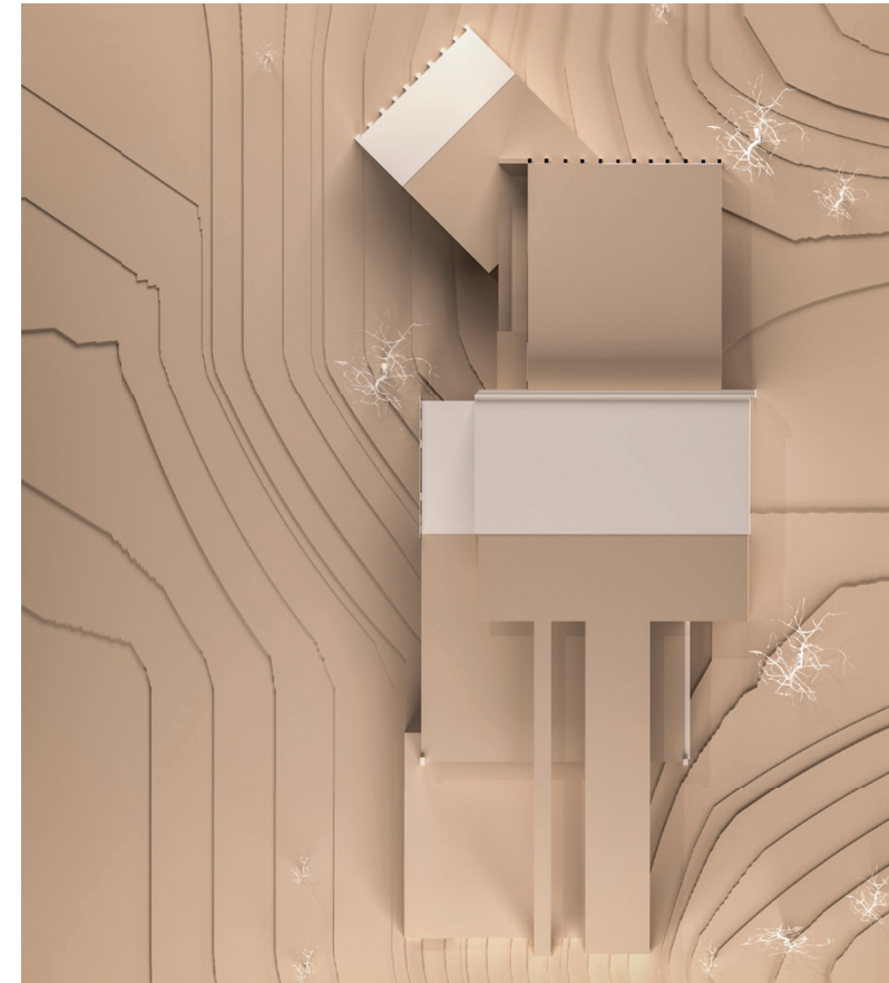
Figura 03 ◀ Visualización general de las cubiertas de la composición.

los primeros empleé el eje debido a que permite reinterpretar las circulaciones establecidas como ejes centrales de la composición y la pauta, mezclada con repetición que ayuda a conectar volúmenes y a crear la ilusión de ser un solo elemento desde la vista superior. En cuanto a los segundos, utilicé la adición por articulación, extrayendo algunos volúmenes presentes de manera no tan protagónica y en las fachadas la adición por seriación de planos o la sustracción por ahuecamiento.