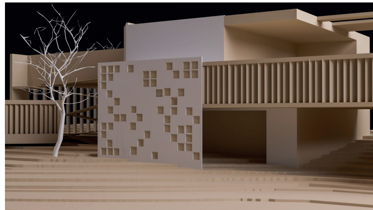
Figura 01 ▼ Visualización general de la composición.

Para el planteamiento de mi propuesta me enfoqué en desglosar el significado de “tranquilidad” desde la arquitectura y logrando una relación con el minimalismo, donde se opta por integrar geometrías en su forma más básica sin perder su atractivo, esto se toma como un referente a plasmar en mi composición. La forma básica desglosada y estética que a su vez transmite un sentimiento armónico al usuario. Dentro de mi propuesta se respetaron las rutas y circulaciones ya preexistentes en el terreno, así que opté por emplazar el proyecto siguiendo la dirección de estas.