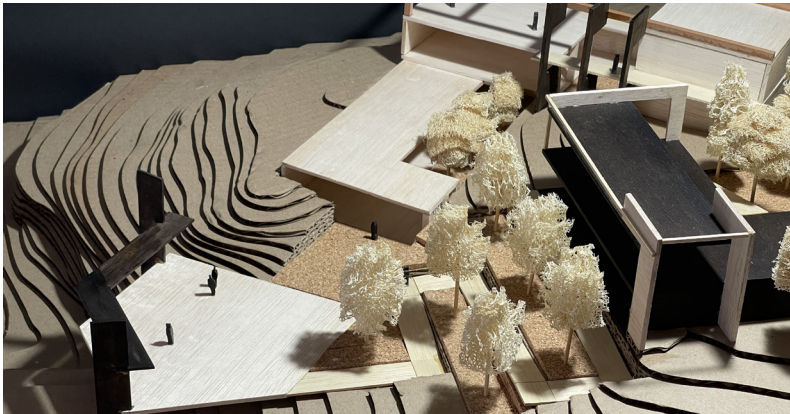
Figura 03 ◀ Maqueta de la composición arquitectónica.