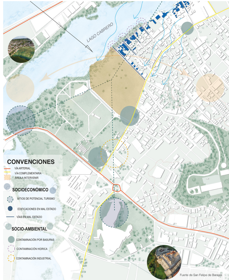
Figura 01 ▶ Plano general del área de intervención.

por medio de infraestructura vial y de espacio público con áreas recreativas y comerciales. En segundo lugar, la adaptación anticipada a desastres naturales ,como inundaciones, por medio de viviendas diseñadas como casas anfibas. Finalmente, la conectividad turística implementando recorridos elevados para articular el centro histórico con las áreas residenciales.