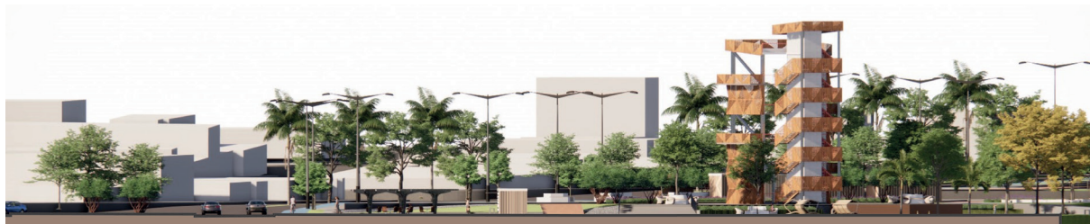
Figura 03 ▼ Perfil urbano.

Borja, J. (2003). La ciudad conquistada.