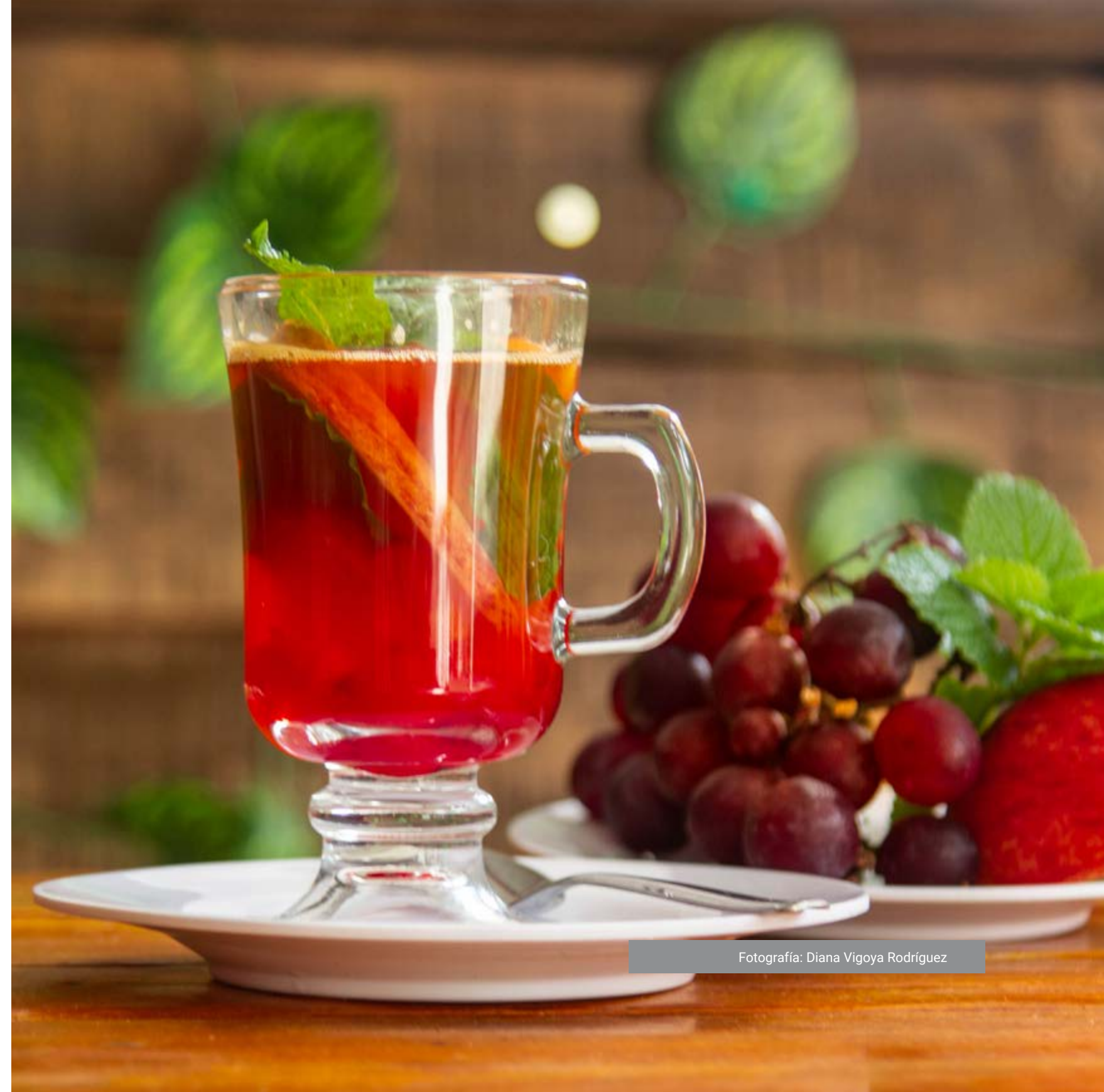
Fotografía: Diana Vigoya Rodríguez

Otro tema es acerca de cómo debemos acoger en cuando se nos presente, sin embargo, nos explica que estas nuevas oportunidades en muchos casos están “disfrazadas de infortunio”. En mi vida personal no me han sucedido esta clase de situaciones, aunque a menos de que grabemos nuestra vida o estemos pendiente de todas las personas a nuestro alrededor, lo cual es actualmente bastante complicado por cuenta propia. Es crucial que analicemos las decisiones que tomemos, pero nunca olvidar que debes confiar en que las decisiones realizadas son las correctas, a pesar de no haber tomado esa oportunidad disfrazada no debemos dejar de insistir, no rendirse ante el primer fracaso, en caso tal de no estar seguros podemos tomar apoyo en terceras personas con conocimiento más a fondo del