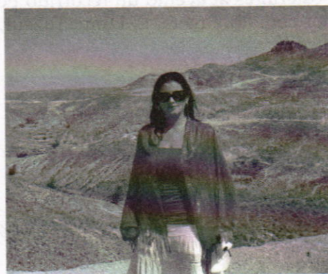
Matmata, escenario donde se filmó la primera película de la Guerra de las Galaxias en el año de 1979.