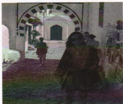
Sidi Bou Said, la ciudad santa con más encanto y más pintoresca de Túnez.