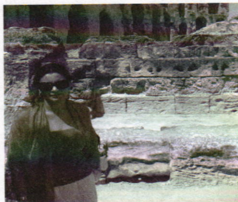
Anfiteatro romano de El Djem, construido en el siglo II.