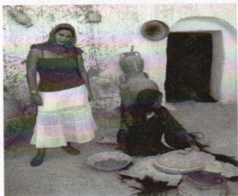
Matmata, a 20 kilómetros del Oasis de Gabés, población célebre por las casas y familias trogloditas.

año 1996. Se adaptó este método a las necesidades analizadas en esta investigación presentando una propuesta metodológica que permite incluir algunas estrategias didácticas como: la clase, la monitoría, el coloquio, el seminario, la exposición y el círculo de trabajo, acompañado de una pequeña reforma curricular que incluya asignaturas que permitan sensibilizar a los estudiantes para que puedan tener una mayor comprensión e identidad de su pueblo, más en estos tiempos multiculturales, de movilidad académica, etc. La misión de la universidad es elevar el nivel cultural de su pueblo, la tolerancia y el desarrollo social; esto se puede lograr con la comprensión de los problemas que los pueblos hacen a través del humanismo. De esta manera se busca romper las tendencias educativas de la Unión Europea, que manifiestan en el papel la importancia de la cultura, pero la